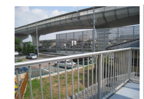
広々としたバルコニーからの眺望 お洗濯物もたっぷり干せます