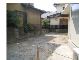
一戸建ならではの庭スペース