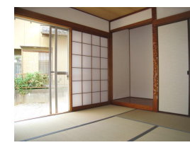
明るい南向きの和室